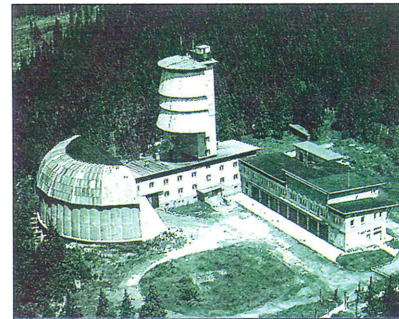
Bývalý vojenský objekt na Polední hoře

a silnicí Javorná - Železná Ruda využita armádou jako výcvikový prostor a střelnice (Vojenský újezd Dobrá Voda) a tím byla izolace Poledníku od okolního světa téměř dokonalá.