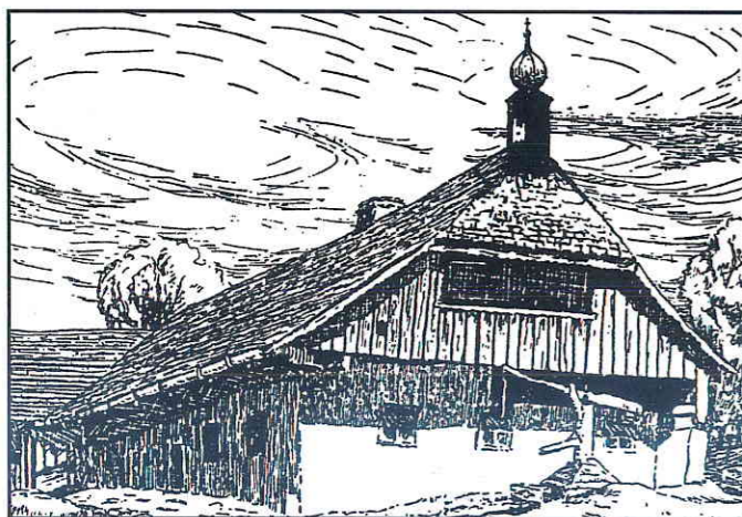
Selský dům s věžičkou