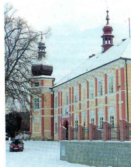
Zámek v Česticích

Šumavské Podlesí je protkáno poměrně hustou sítí vedlejších silnic. Většinu obcí spojují ve všední dny autobusové linky se spádem do Strakonice či Vimperka, o víkendech však bývá spojení jen jednou denně nebo žádné. Přímá autobusová linka spojuje Prahu se Stachy přes Vacov (například v sobotu vyjíždí autobus z pražského nádraží Na Knížecí v 9.25 h a na místě je ve 12.10 h). Mezi Strakonice, Volyní a Vimperkem jezdí každé dvě hodiny vlak.