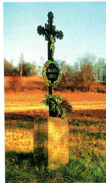
Při cestě z Úbislavi do Stach

V roce 2008 vám bude IN magazín pravidelně přinášet nový seriál reportáží, v nichž se tentokrát zaměříme na české a moravské mikroregiony.