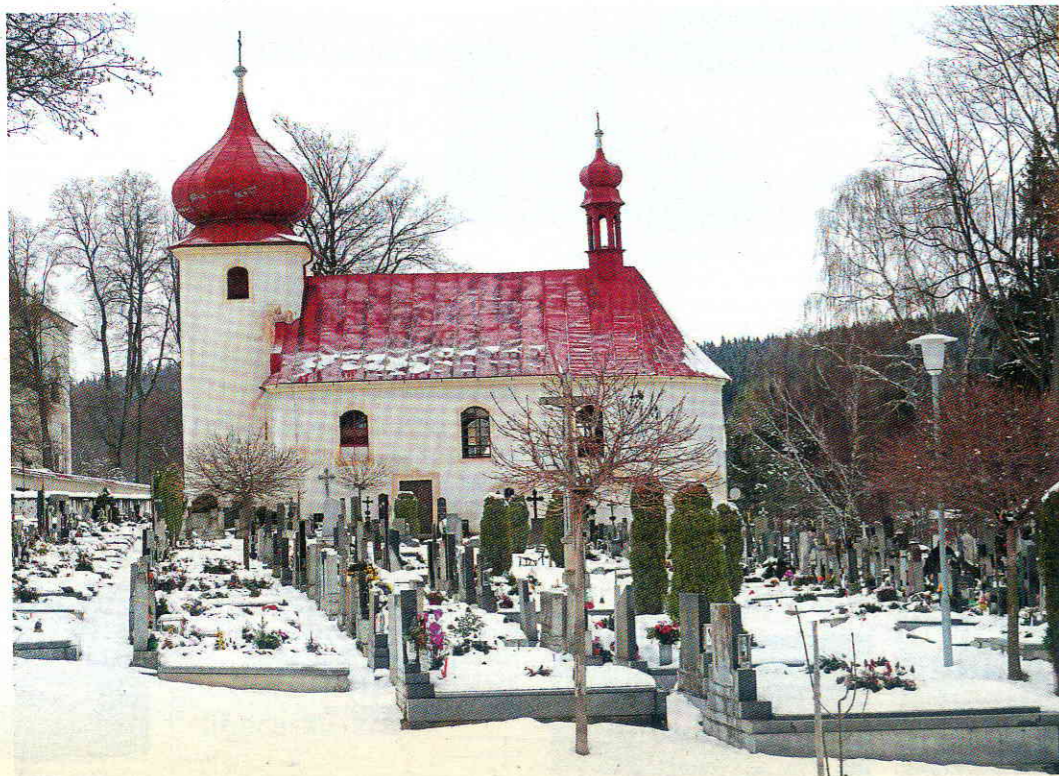
Hřbitovní kostel ve Stachách, zasvěcený Bolesné Panně Marii, pochází z období pozdního baroka.

Podlesí označuje území „pod lesem“, v tomto případě pod lesem pomezním, šumavským. Malebná krajina mezi Vimperkem, Volyní a Javorníkem se tu zvedá z úvalů jihočeských řek Otavy a Volyňky a nabírá dech, aby posléze přešla do horských výšek centrální Šumavy.